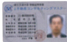
シルバーカード (初回認定、更新1回目の方)