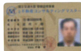
ゴールドカード (更新2回目以降の方)